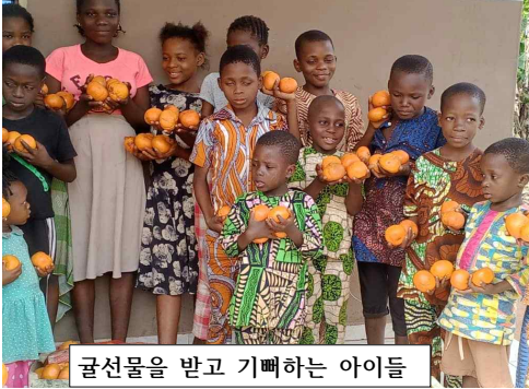
과선물을 받고 기뻐하는 아이들