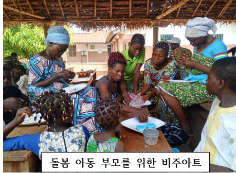
돌봄 아동 부모를 위한 비주아트