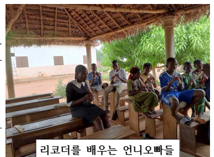
리코더를 배우는 언니오빠들

고아원은 인증을 받고 나서 다른 고아원으로 보내진 친구들과 또 새로운 친구들을 맞이하기 위한 준비가 이루어지고 있습니다. 아직 부족한 부분이 있지만, 조만간 친구들이 생활할 수 있는 환경적, 인적 여건이 마련되리라 기대하고 있습니다. 고아원과 센터를 시작하면서 우리의 시간표와 하나님의 시간표가 많이 다르다는 것을 실감하게 됩니다. 하나님이 일하시지 않으면 한 발짝도 앞으로 나갈 수 없는 것도 깨닫게 되