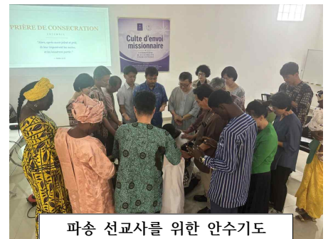
파송 선교사를 위한 안수기도