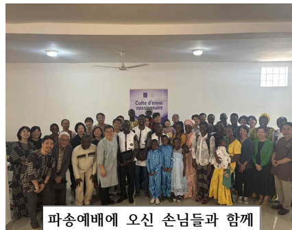
파송예배에 오신 손님들과 함께